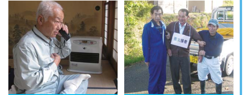
集落が孤立した場合は、衛星携帯電話で連絡をとります。自力避難が困難な方には、避難の助け合いをお願いします。

※冠水などで避難所へ行く道が危険な場合は、近くの高い場所(自宅2階のがけと反対側の部屋など)に避難の方が安全な場合があります。