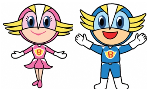
長岡市オリジナル防災キャラクター 「ボーサイダー」